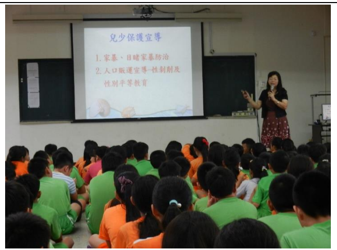
活動說明：人口販賣及性別宣導。