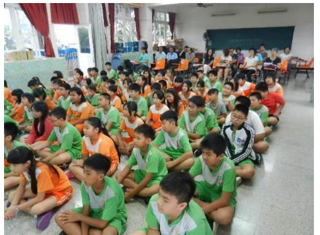
活動說明：兒童均能了解到自己權利義務，受到國家法律的保障。