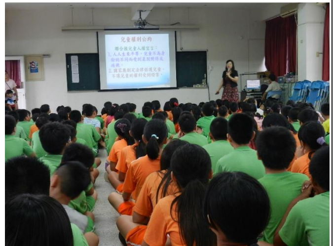
活動說明：介紹兒童權利兩公約介紹，人人生而平等，而不受到不同待遇。