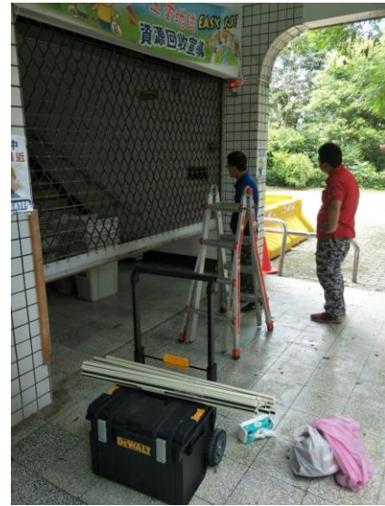
圖片說明 紅外線感應器裝設-本校