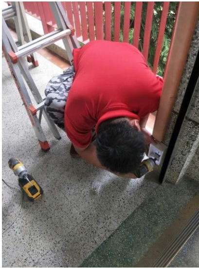
圖片說明 紅外線感應器裝設-本校