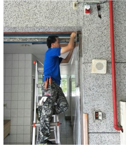
圖片說明 紅外線感應器裝設-本校