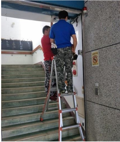
圖片說明 紅外線感應器裝設-本校