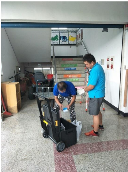
圖片說明 紅外線感應器裝設-分校