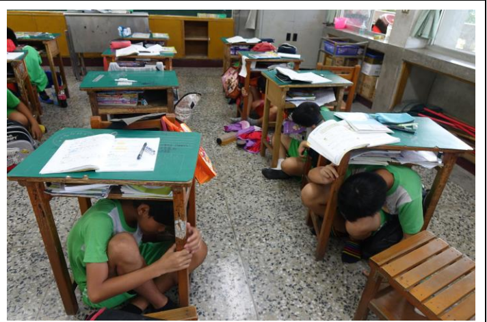
圖片說明：地震發生前段，施作保命三步驟「趴下、掩護、穩住」。