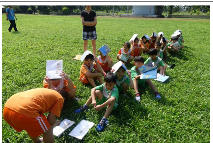
圖片說明：導師點名予以通報。