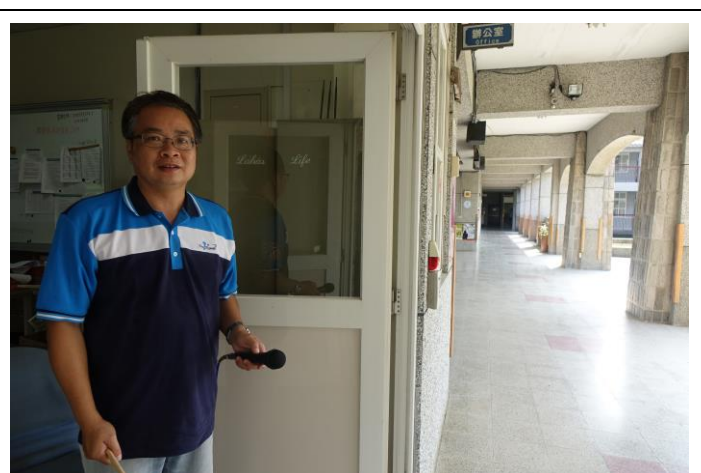
圖片說明：災情確認，請求支援。