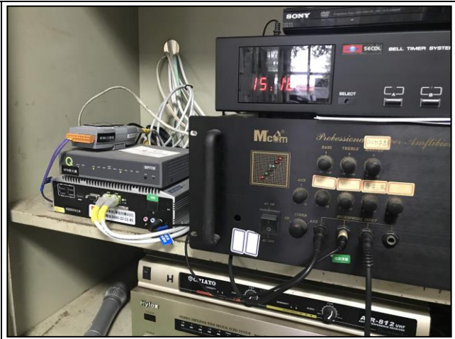
圖片說明：強震即時警報系統與廣播器。