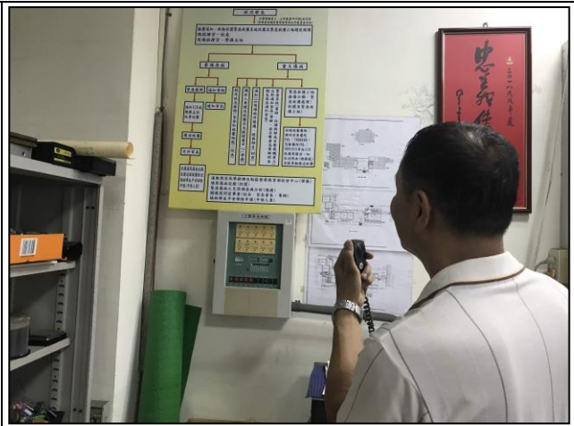
圖片說明：火警受信總機及災害警報廣播系統。