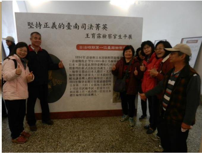
活動說明：參觀堅持正義司法界有所貢獻的檢察官生平介紹。