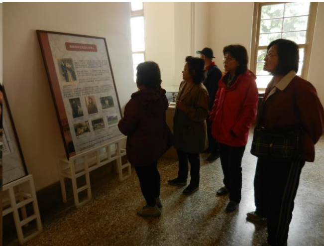
活動說明：參觀法院所使用器物及文件書信往來的介紹。