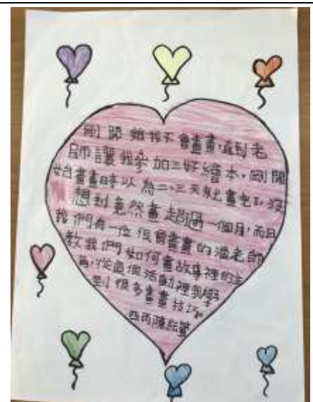
活動說明：謝謝老師帶領我們開起繪本的路。