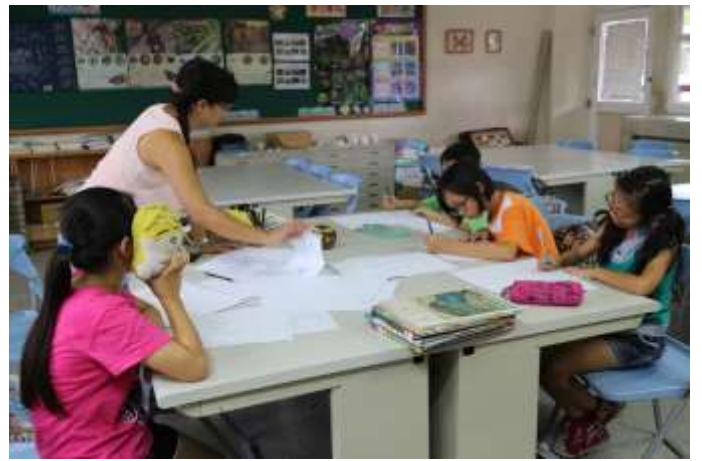
活動說明：老師指導學生如何製作繪本。