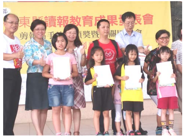
活動說明：簡報高手比賽頒獎