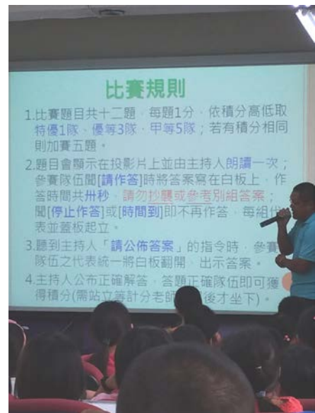
活動說明：讀報擂台賽及比賽規則講解。