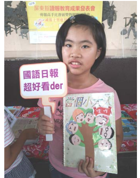
活動說明：讀報成果發表會。