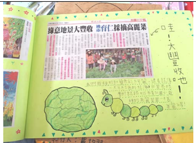
活動說明：簡報高手作品。